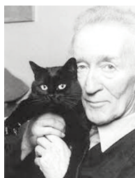
CLAUDE ROY (París, 1915 – 1997)

Esta es la historia absolutamente cierta de este gato parlanchín y de su mejor amigo, un muchacho que tiene que ingeniárselas para que nadie descubra las extraordinarias habilidades de su gato. Al fin y al cabo, como todo el mundo sabe, ningún gato del mundo quiere hacerse famoso, porque... ¡se está tan bien al sol sin hacer nada!